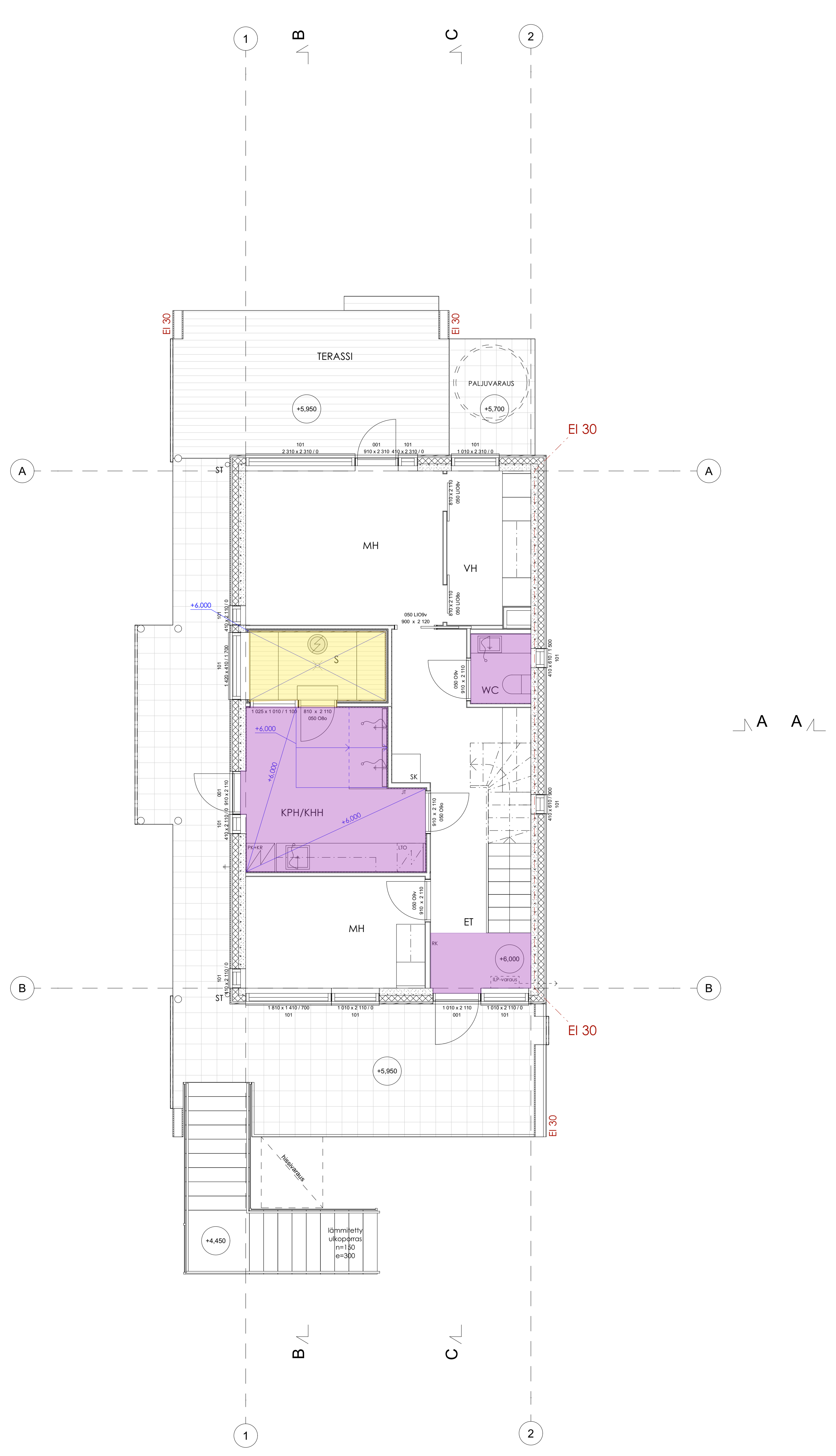
RAK. 1 1. KERROS